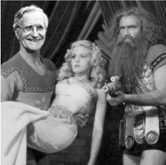
Flash Chomsky rettet Dale Arden aus den Fängen des Imperator George W. Ming

Die zweite Frage zu Doppelmoral und Verschleierungstaktiken will ich hier an zwei Beispielen aus der Theorie und Praxis von Noam Chomsky darstellen.