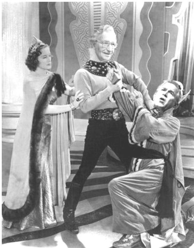
Flash Chomsky im Kampf gegen Imperator George W. Ming